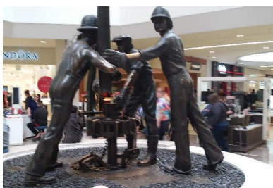
Socha v pasáži připomíná zdroj bohatství

Kolej mi připomněla studentská léta v Chicagu. Nakonec, zas tak izolovaná Kanada není. Stejný typ záchodu, stejná sprcha, kde nejde regulovat množství vody, a teplotu nemůžete nastavit, aniž byste stáli pod ní. Takže to na začátku mrazí a pak paří.